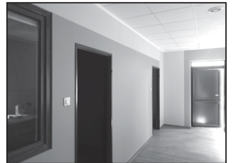
Świetlica w Remiszewie