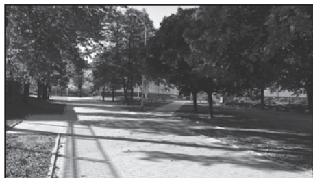
Przebudowa pasażu między ulicą 9 Maja i Polną