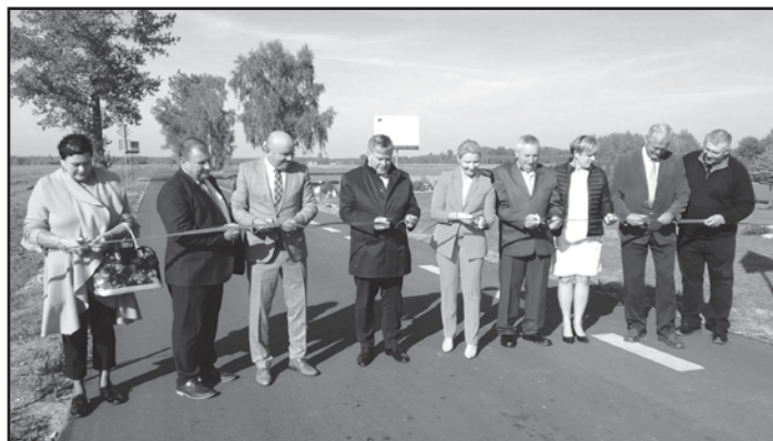
Droga Malenia – Gucin