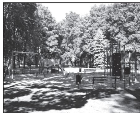
Nowy plac zabaw w parku miejskim