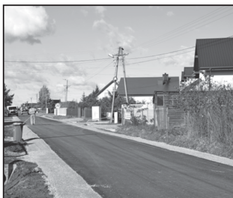
Budowa drogi w Orchowie