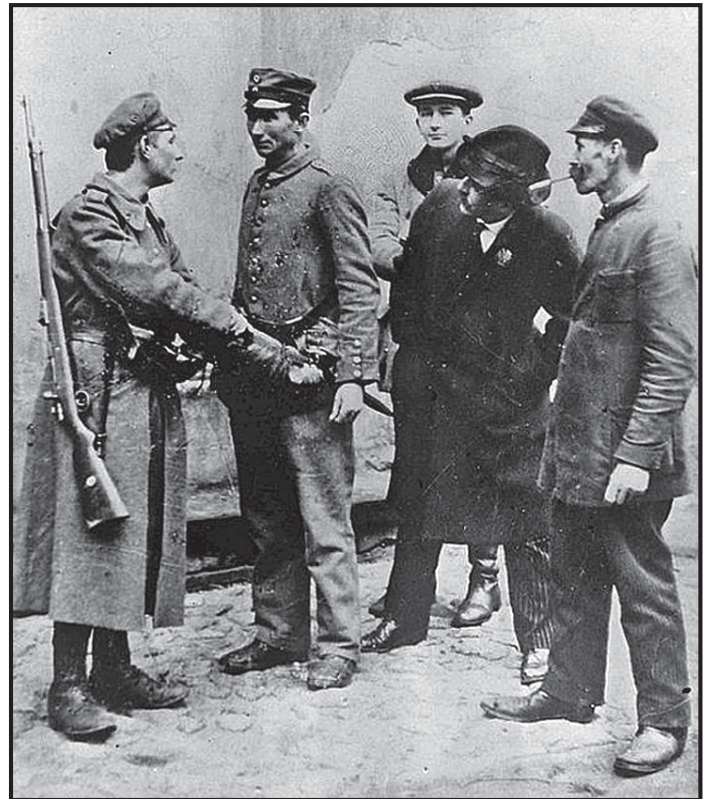
Rozbrajanie Niemców w stolicy, 11 listopada 1918 r.

Baczni obserwatorzy łaskiej sceny politycznej wiedzą doskonale, że okres POW i Legionów to swoista szkoła patriotyzmu także dla młodzieży łaskiej, której już niedługo przyjdzie brać udział w wojnie z Sowietami, potem tworzyć zręby państwowości polskiej i budować kraj