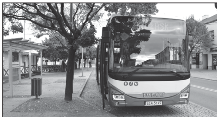
Nowoczesne autobusy na ulicach Łasku