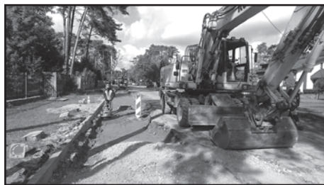
Rozbudowa sieci kanalizacji w Kolumnie