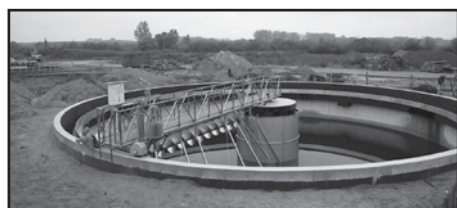
Budowa oczyszczalni ścieków