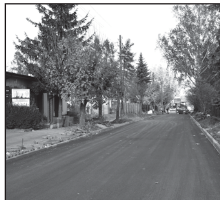
Przebudowa ulicy Przemysłowej