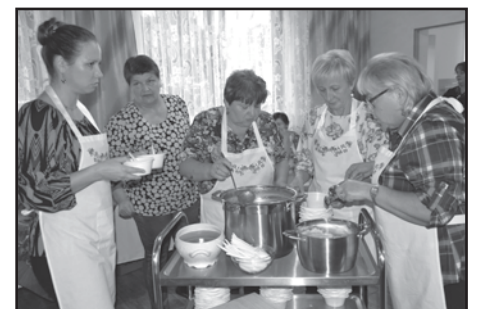
Warsztaty kulinarne we Wrzeszczewicach