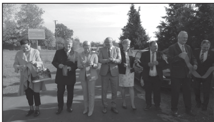
Droga w Woli Bachorskiej