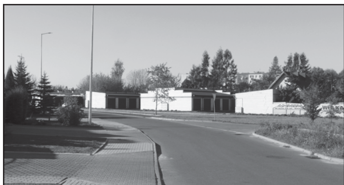
Nowy chodnik i miejsca parkingowe na ul. Dębowej