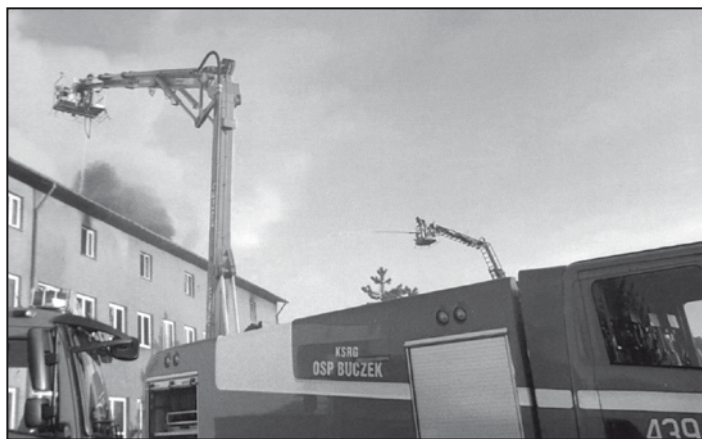
Pożar zakładu garbarskiego w Gorzynie

A miejscowe zagrożenia? Zalicza się do nich także te związane z usuwaniem skutków silnych wiatrów, dużych opadów deszczu czy też z usuwaniem skutków wypadków na drogach. W 2019 roku było ich 578, ale w 2017, gdy przez nasz region przeszły wichury i porczyły w lasach olbrzymie szkody, odnotowano ich aż 1063. W 2011 roku tego typu zagrożenie było tylko 361 i wygląda na to, że raczej nie dojdzie do takiej niskiej powtórki. Czy zbudowanie drogi ekspresowej S-8 wpłynęło na wzrost wypadków i powiększenie się tej statystyki? - Wprost przeciwnie - mówi P. Rudecki.