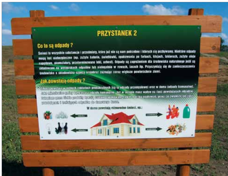
Na dawnym składowisku odpadów w rejonie Orchowa można się dowiedzieć, jak należy chronić przyrodę

▶ Piętro wodonośne górnokredowe zasilane jest przez wody opadowe i pochodzące z infiltracji. Miąższość wynosi średnio 110-133 m. Największą wydajność odnotowano w rejonie Kolumny (120 m sześć./ha), sporą bo w granicach 70 m sześć./h - w dolinie Grabi. To z tych zasobów czerpią wodę ujęcia dla Łasku i w Bałczu.