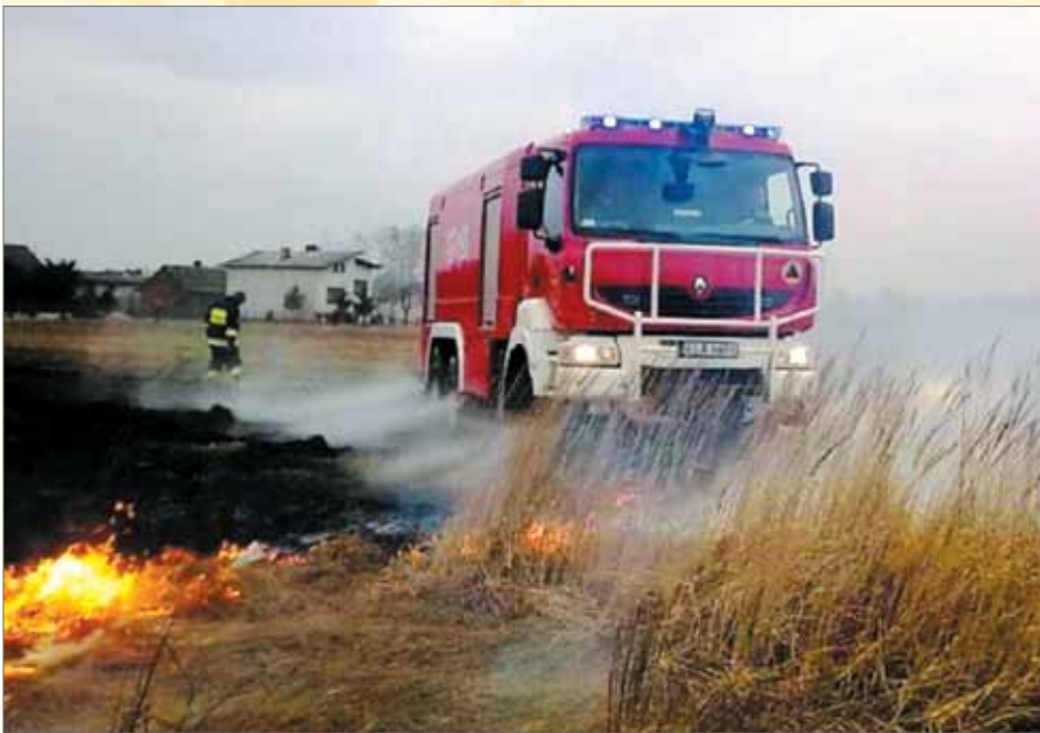
Pożar traw, Kustrzyce

Bezmyślne wypalanie traw w naszym powiecie powraca co roku jak bumerang. Dzieje się tak zwykle późną zimą i wczesną wiosną. W tym czasie znikają połacie śniegu zalegające na polach, łąkach, na trawnikach, a wiatr i promienie słoneczne przesuszają wierzchnią warstwę gleby. Sprzymierzeńcem w wiosennych porządkach dla wielu nierozważnych i bezmyślnych osób stał się ogień. Mimo, że wypalanie traw jest szkodliwe, niedozwolone i bardzo niebezpieczne, co roku sporo mieszkańców właśnie w ten sposób „oczyszcza” swoje pola, łąki i trawniki. Nieodpowiedzialność osób wypalających trawy i pozostałości roślinne powoduje niejednokrotnie powstanie tragicznego w skutkach pożaru, doprowadzając do tego, że giną ludzie, zwierzęta, a także płoną lasy, zabudowania mieszkalne i gospodarcze.