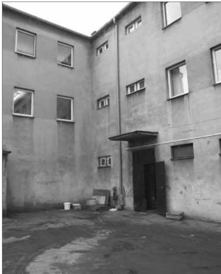
Dawna poczta od strony podwórza