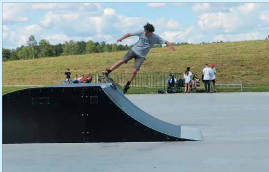
W przyszłości dawne składowisko odpadów będzie miejscem wypoczynku mieszkańców Łasku. Już dziś młodzież korzysta chętnie ze skateparku

gruntu. Ale podziemne wody zanieczyszczyć mogą też nawozy sztuczne spływające z pól, stacje paliw czy odcieki ze składowisk odpadów.