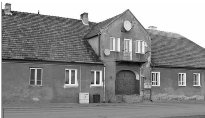
Zajazd pocztowy z przełomu XVIII i XIX w. w Ostrowcu Świętokrzyskim