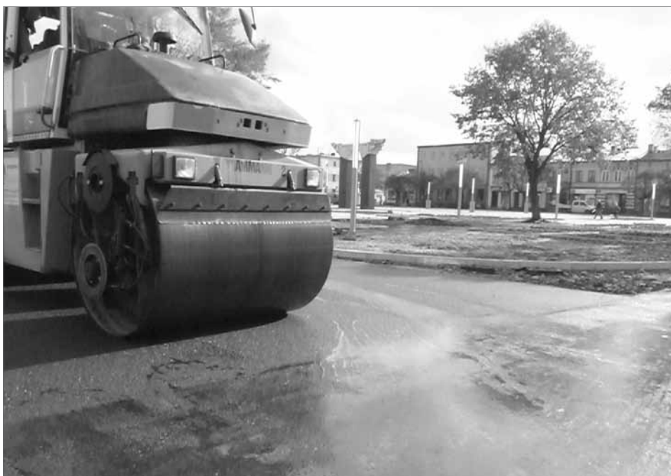
Ostatnie prace przy układaniu asfaltu na zrewitalizowanym rynku