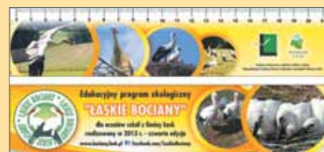
Zakładka do książki