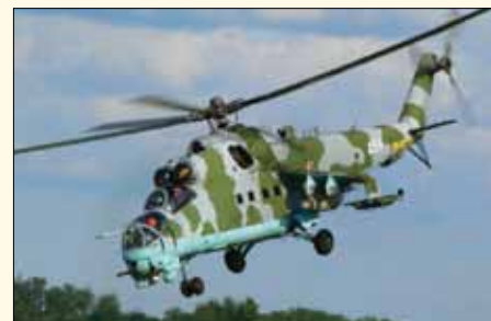
Szturmowy śmigłowiec Mi-24 w akcji