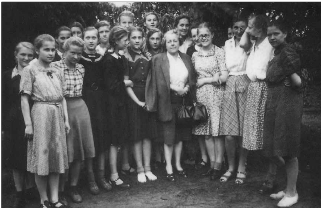
1951 r. Dziewczęta z klasy VIII-2

Z odległości ponad 60 lat wydaje się, że wiele problemów rozwiązywaliśmy lepiej.