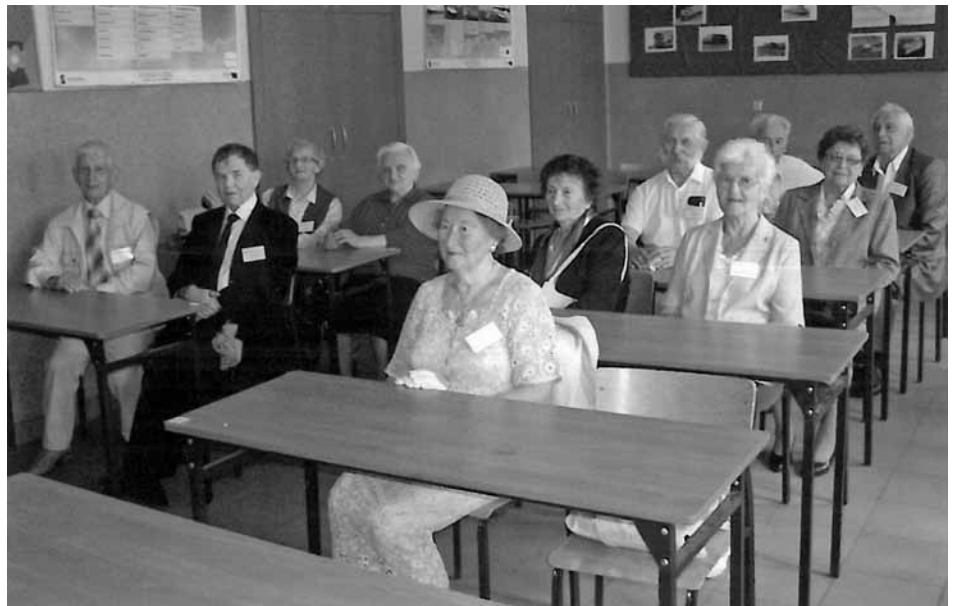
Spotkanie po latach

Wkrótce po skończeniu Liceum część z nas rozpoczęła studia, inni przystąpili do pracy zawodowej. Mimo skromnych możli-