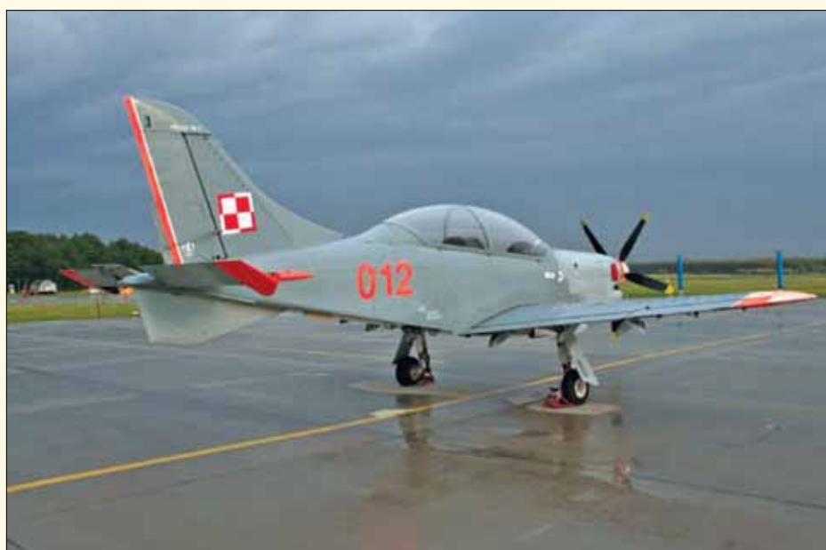
...a tak prezentuje się po remoncie

Stowarzyszenie Entuzjastów Lotnictwa „Grupa Archeo Łask” od 2011 roku propaguje wiedzę o polskich skrzydłach, a przy okazji systematycznie rozwija kolekcję samolotów historycznych w 32. BLT. Jednak miłośnicy lotnictwa skrzyknęli się trzy lata wcześniej z inicjatywy ówczesnego dowódcy płk. dypl. pil. Władysława Leśnikowskiego.