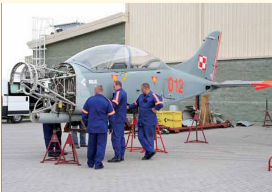
A oto jedna z maszyn podczas prac rekonstrukcyjnych...