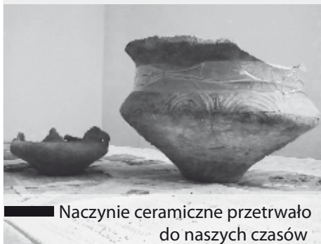
Naczynie ceramiczne przetrwało do naszych czasów