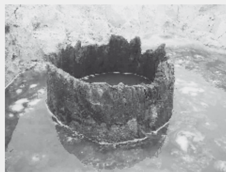
Dobrze zachowana drewniana studnia

Ta imponująca kolekcja zabytków kultury łużyckiej na wniosek burmistrza Gabriela Szkudlarka została, decyzją łódzkiego wojewódzkiego konserwatora zabytków (z 28 listopada 2012 r.) w całości przekazana w depozyt Bibliotece Publicznej im. Jana Łaskiego Młodszego (właścicielem zabytków jest Skarb Państwa). Fizycznie zostaną one dostarczone najprawdopodobniej w maju bieżącego roku. W przyszłości eksponaty trafią do Muzeum Historii Łasku, które powstanie w odrestaurowanej kamienicy przy Placu 11 Listopada nr 7. Prawdziwą perłą w zbiorze będzie doskonale zachowana studnia dębowa o średnicy ok. 80 centymetrów. Zostanie ona już niebawem przekazana do konserwacji przez specjalistów z Muzeum Archeologicznego w