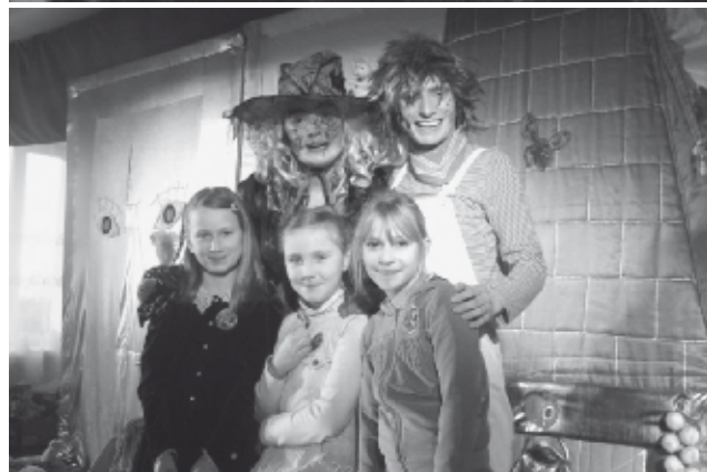
Ogłoszenie współfinansowane ze środków Unii Europejskiej w ramach Europejskiego Funduszu Społecznego