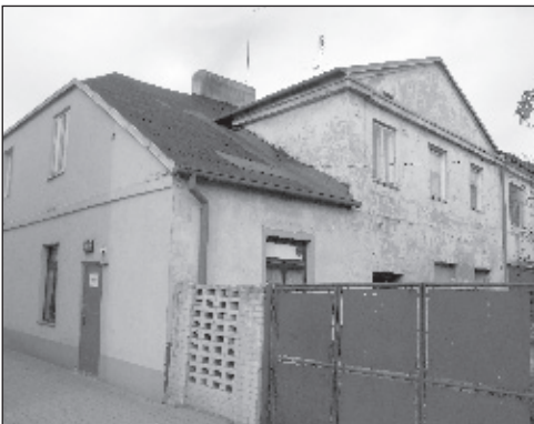
Kamieniczka pod nr 7 w rynku od strony podwórza, w niej za kilka lat mieścić się będzie łaskie muzeum