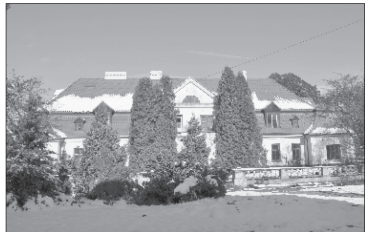
... i po remoncie