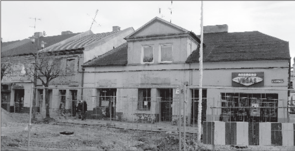
Na kamieniczce pod nr 6 pojawił się wreszcie nowy dach

Modernizacja płyty łaskiego rynku stała się zaczynem do działania dla kilku właścicieli kamieniczek. Powstał wreszcie nowy dach na niewielkiej kamieniczce nr 6 we wschodniej pierzei, która przez kilka ostatnich lat szpeciła centrum miasta. Elegancka nowa brama pojawiła się też w północnej pierzei, zastępując stary obskurny wjazd do dwóch kamieniczek. Solidny remont czeka też kamieniczkę oznaczoną nr 7, w której w przyszłości znajdzie się Muzeum Historii Łasku.