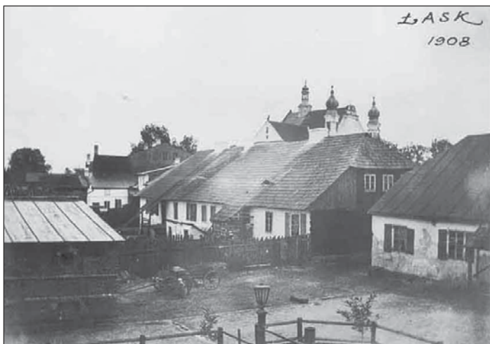
Widok Łasku, 1908 rok