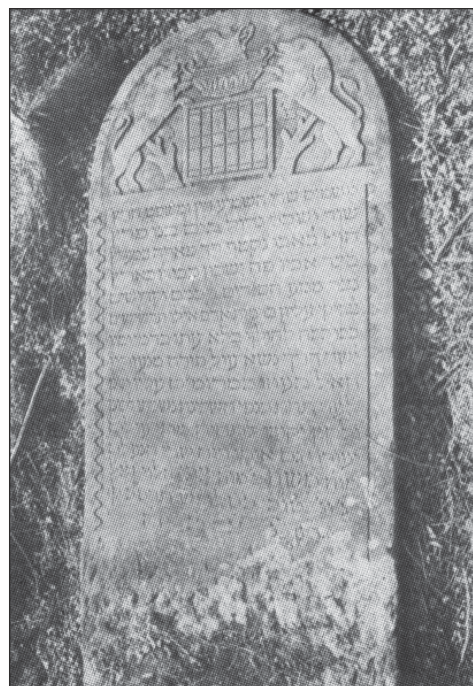
Jeden z nagrobków cmentarza żydowskiego w Łasku