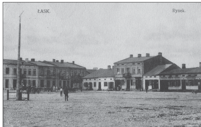
Łaski rynek przed I wojną światową

Właściciele Łasku, dysponujący 7 folwarkami, wszelkimi sposobami szukali dodatkowych dochodów. Mieszczanie musieli nabywać alkohol wytwarzany w dworskim browarze czy gorzelnii, także zboże mogli mleć tylko w pańskich młynach. Było też sporo obciążeń fiskalnych, choćby „kominowe za wycieranie sadzy” czy za prawo sprzedawania mięsa lub żelaza, płacić trzeba było też za prawo sprzedawania soli. Obciążenia te dotyczyły szczególnie ludność żydowską. Jednak w 1 połowie XIX wieku, gdy ludność żydowska zyskała od dziedziców Czolchańskiego i Wierzbowskiego wiele dodatkowych uprawnień, jej stan materialny uległ poprawie. Różnorodne ulgi dotyczyły także mieszczan łaskich.