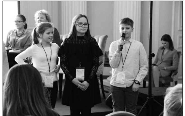
Jedna z prezentacji