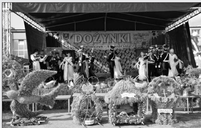
Reaktywacja dożynek o charakterze powiatowym