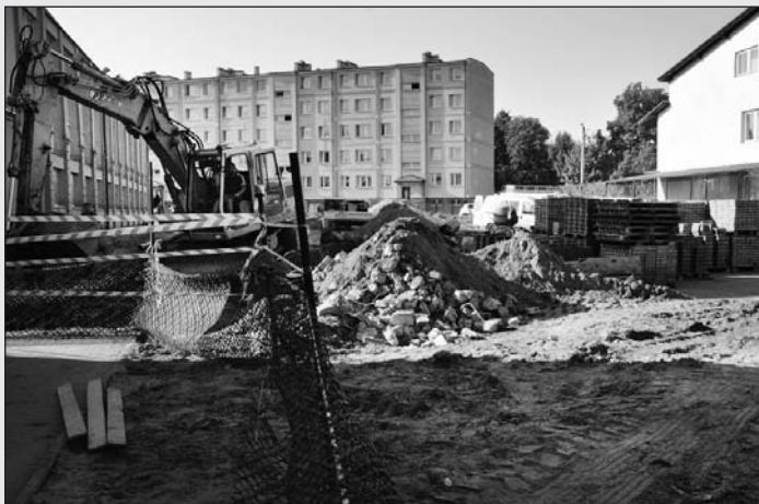
Budowa boiska wielofunkcyjnego i siłowni zewnętrznej przy ZSP nr 1 w Łasku