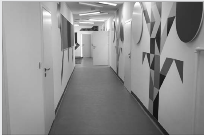
Remont Specjalnego Ośrodka Szkolno-Wychowawczego w Łasku