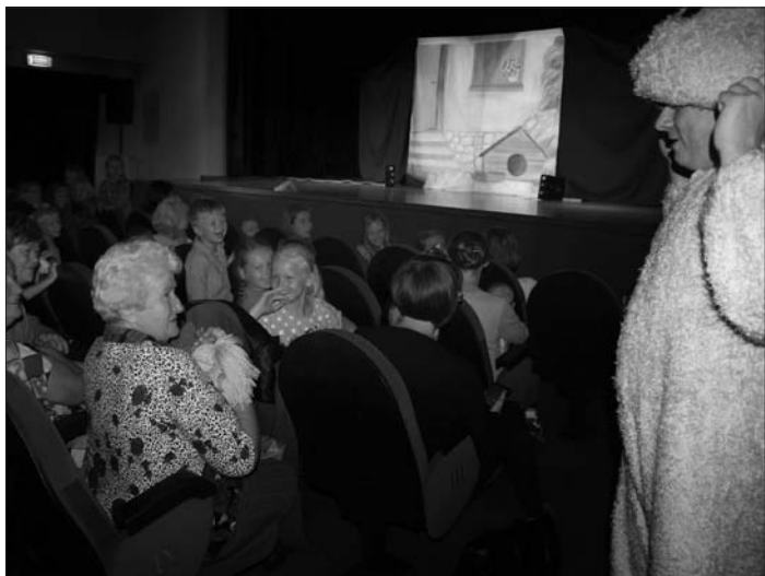
Spektakl teatralny „Regio”

Wakacje minęły jak co roku – zbyt szybko. Całe szczęście wrześnie aura pozwoliła nam jeszcze trochę nacieszyć się słońcem i przywołać letnie wspomnienia. A ci, którzy odwiedzili podczas wakacji Łaski Dom Kultury, z pewnością będą te chwile wspominać bardzo długo.