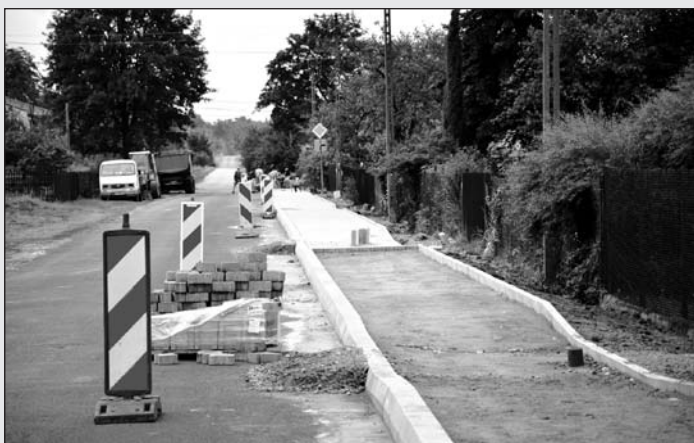
Przebudowa drogi powiatowej Buczek-Luciejów