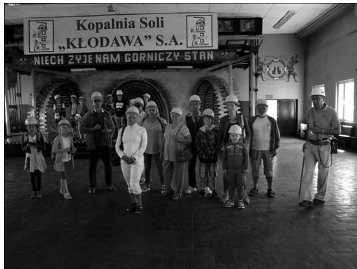
Wycieczka do kopalni soli w Kłodawie

Lipiec rozpoczęliśmy wycieczkowo – propozycja wyjazdu do Kopalni Soli w Kłodawie znalazła spory odzew wśród mieszkańców. Uczestnicy eskapady zjechali windą pod ziemię na głębokość 600 metrów, gdzie obejrzeli kaplicę św. Kingi, wyeksploatowane komory solne oraz maszyny używane w podziemnym górnictwie solnym, a także wysłuchali od przewodnika wielu ciekawostek dotyczących powstania złóż kłodawskich. Wyprawa dostarczyła wszystkim niezapomnianych emocji, tym bardziej, że zakończyła się wieczorną kąpielą w basenach termalnych w Uniejowie.